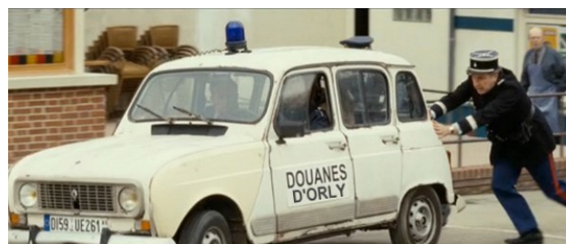
Merci Roissy et en route pour CUSCO !

Il ne nous en a pas dit plus concernant les autres services d'Orly.